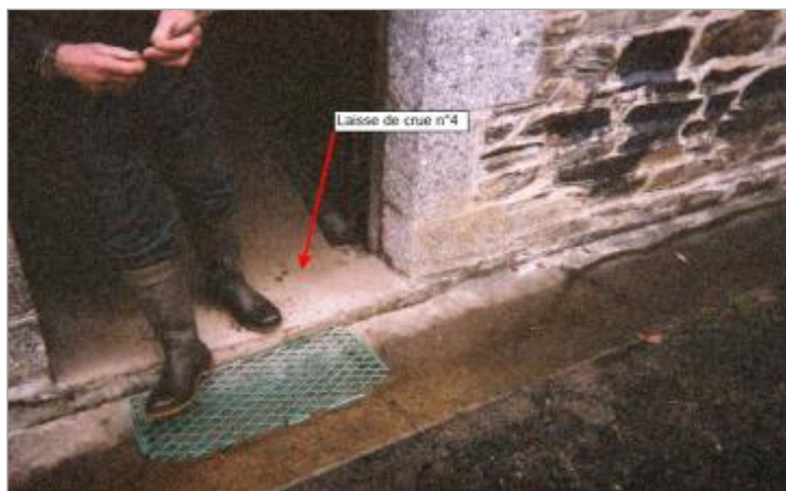
Relevé de l'inondation de février 2001 à l'entrée du moulin

Différence entre le niveau d'eau et la référence (en m) : 0.260 m