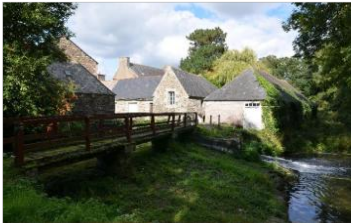
Moulin de Milin Coz à Langoat en 2013