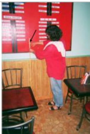
Interieur du bar-tabac Le Blavet au niveau du panneau des résultats

Différence entre le niveau d'eau et la référence (en m) : 1.330 m