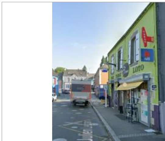
Bar-tabac Le Blavet sur l'île de Locastel

Coordonnées WGS84 : X: -3.24839835 / Y: 47.82649220