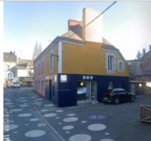
Agence immobilière (ancienne agence bancaire) au 11 quartier Julien Legrand en 2025