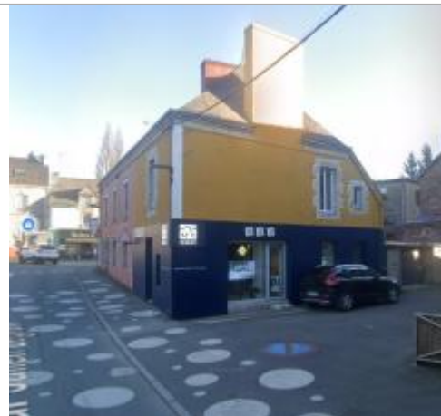
Agence immobilière (ancienne agence bancaire) au 11 quartier Julien Legrand en 2025