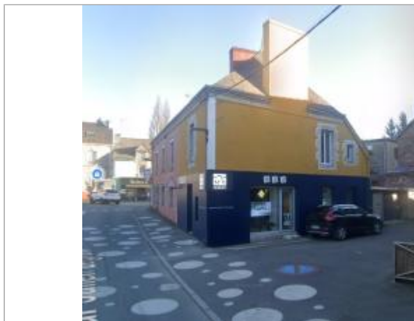
Agence immobilière (ancienne agence bancaire) au 11 quartier Julien Legrand en 2025