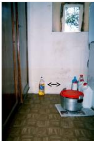
Intérieur de la maison et marque d'inondation de 2001

Différence entre le niveau d'eau et la référence (en m) : 0.250 m