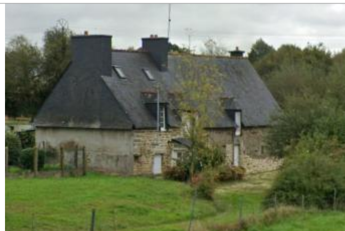
Maison au 79 route de Saint-Michel à Le Sourn