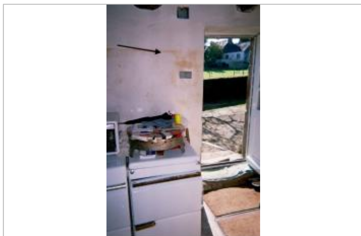
traces d'inondations dans la cuisine