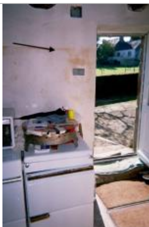
Marque de l'inondation indiquée par le témoin sur le mur de la cuisine