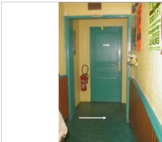
marche sous le lino du couloir du bar face en l'ancien hôpital

Système altimétrique : NGF IGN 1969 (système normal)