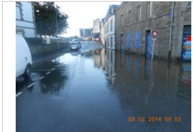
PLACE ERNEST JAN lors de l'inondation