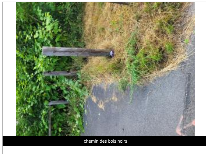
chemin des bois noirs