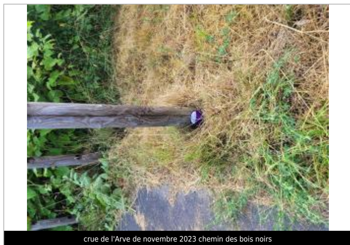
crue de l'Arve de novembre 2023 chemin des bois noirs

Texte : crue de l'Arve du 14 novembre 2023 Maximum de l'inondation : Oui Visibilité : Oui État du repère : Bon Pérennité : Longue Repère calculé : Non PHEC : Oui