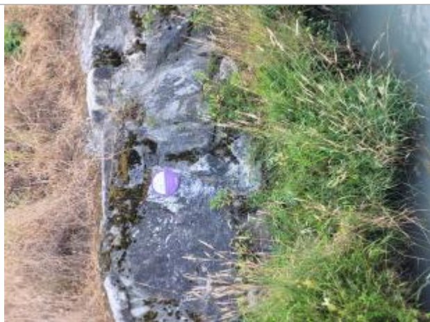
crue de l'Arve de novembre 2023 pont des régies