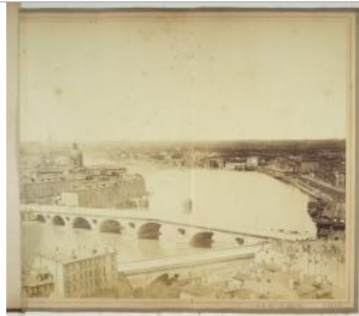
Photo du site à partir de laquelle 3 mesures de laisse de la crue de 1875 ont été réalisées par le SPC GTL

Coordonnées WGS84 : X: 1.44060290 / Y: 43.59861010