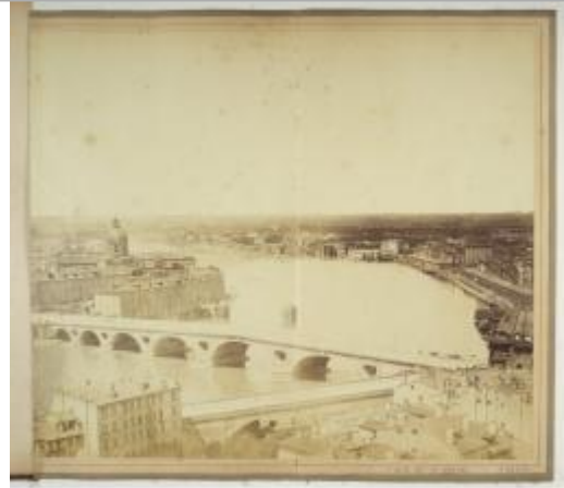
Photo du site à partir de laquelle 3 mesures de laisse de la crue de 1875 ont été réalisées par le SPC GTL

Coordonnées WGS84 : X: 1.44060290 / Y: 43.59861010