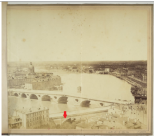
Photo d'époque à partir de laquelle la levée de la laisse de crue de 1875 a été réalisée