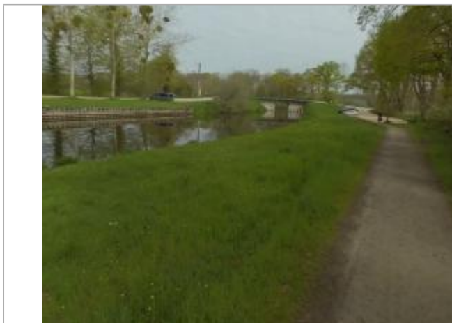
Rive gauche du canal d'Ille et Rance

Coordonnées WGS84 : X: -1.63565085 / Y: 48.20965540