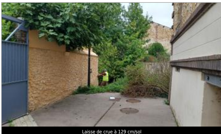
Laisse de crue à 129 cm/sol

SOURCE DE REPÉRAGE : VISITE DE TERRAIN SPC SACN - 11/03/2020