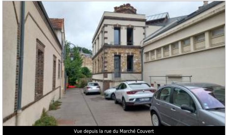
Vue depuis la rue du Marché Couvert

Coordonnées WGS84 : X: 1.36385756 / Y: 48.73563300