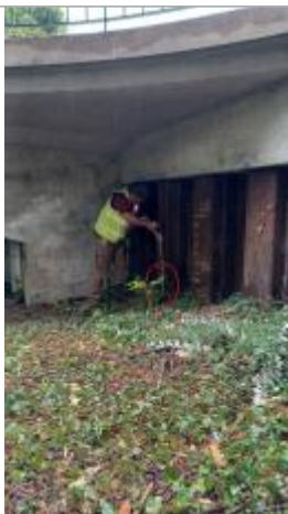
Laisse de crue à 29.5 cm/sol