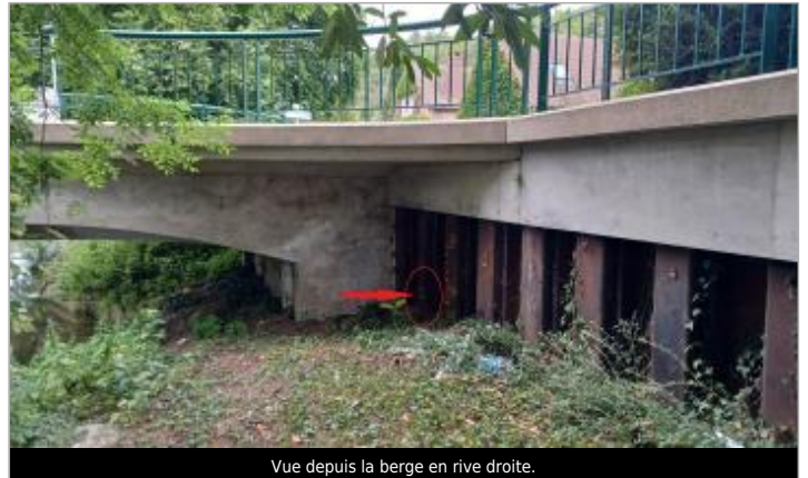
Vue depuis la berge en rive droite.

Coordonnées WGS84 : X: 1.37993341 / Y: 48.77679320