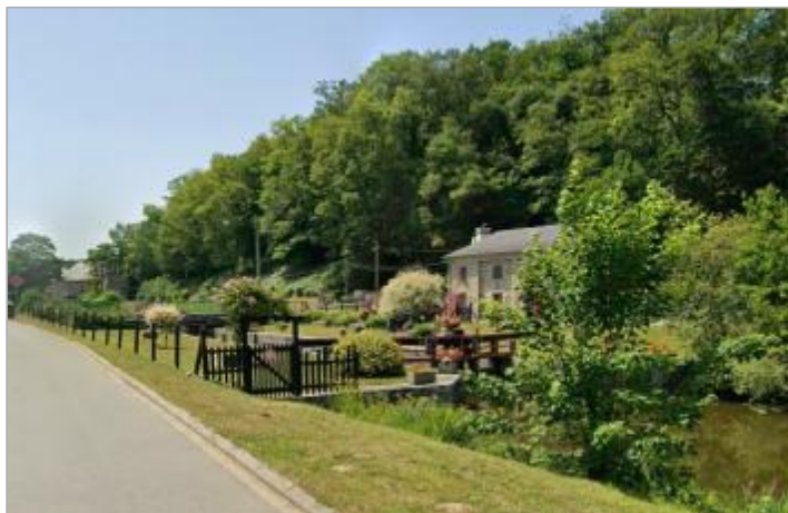
Ecluse de Saint-Germain amont rive gauche du canal

Coordonnées WGS84 : X: -1.66700501 / Y: 48.24842250