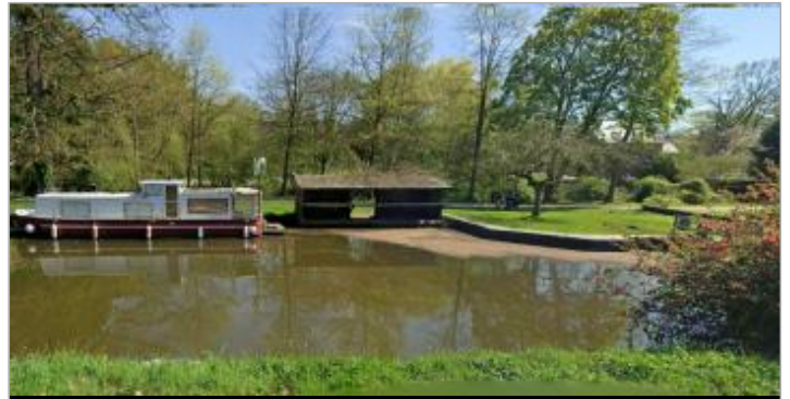
quai d'appontage en amont de l'écluse de Saint-Médard