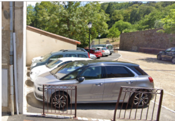
parking av des treilles