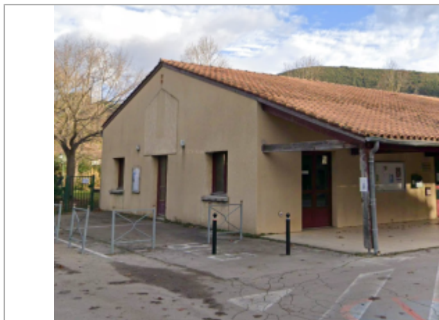
salle polyvalente villemagne