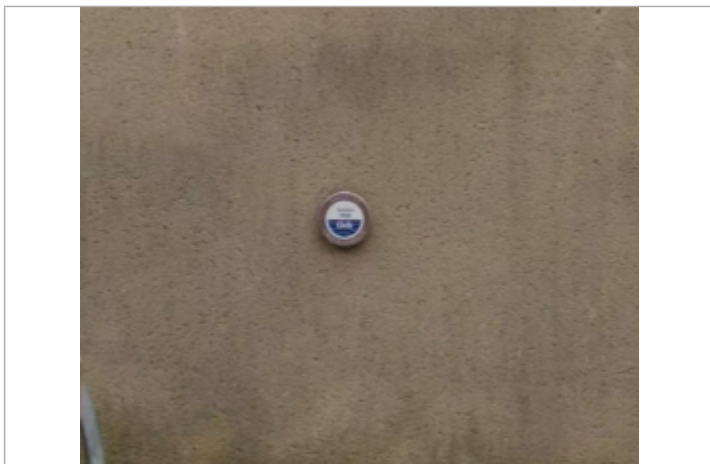
office de tourisme avene