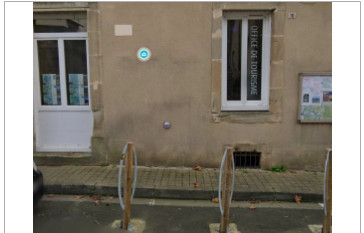
office de tourisme avene