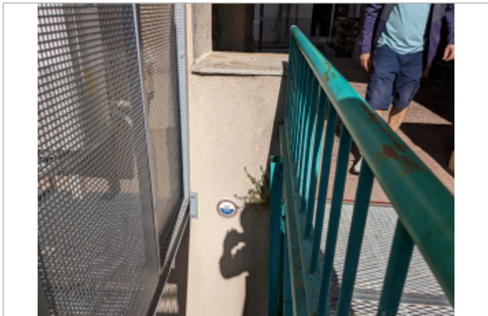
reperer passerelle piétonne