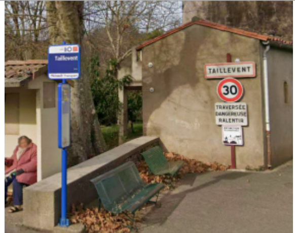
entree hameau taillevent