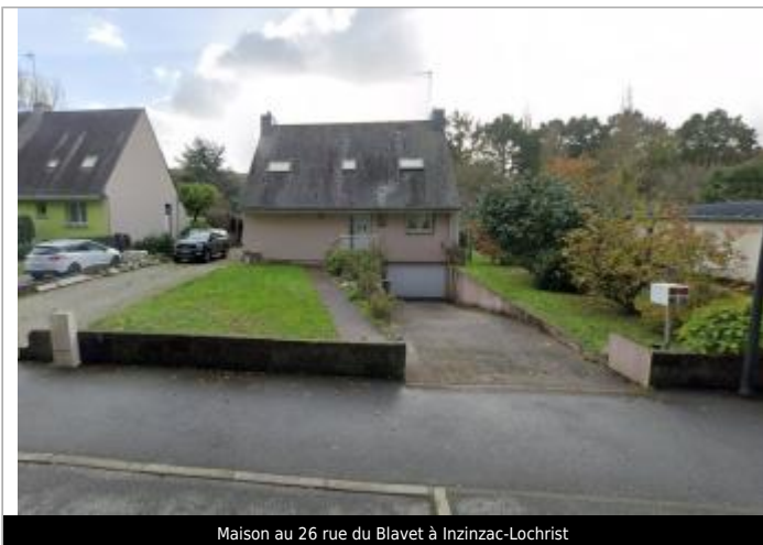
Maison au 26 rue du Blavet à Inzinzac-Lochrist