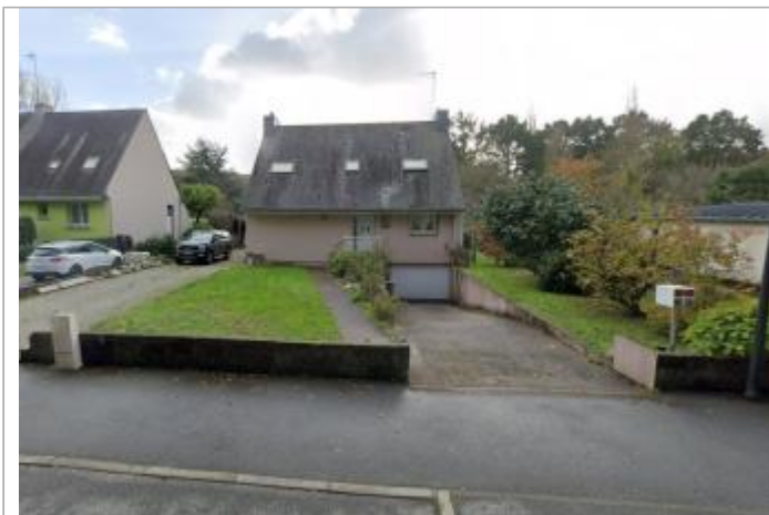
Maison au 26 rue du Blavet à Inzinzac-Lochrist