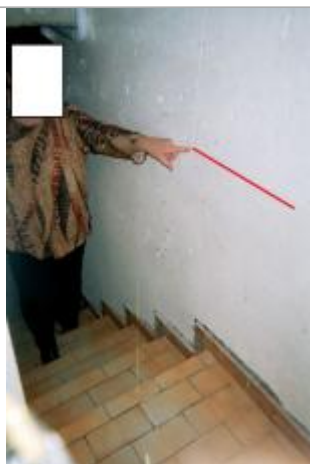
Niveau de l'inondation dans le sous-sol de la maison

Altitude calculée de l'eau (en m) : 9.99 m