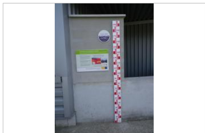
Vue du repère en 2011, source : département du Loiret.

MARQUE Texte : 2 juin 1856 - plus hautes eaux connues - La Loire Maximum de l'inondation : Oui Visibilité : Oui État du repère : Bon Pérennité : Longue Repère calculé : Non renseigné PHEC : Oui