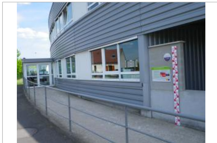
Vue du site en 2011, source : département du Loiret.

GÉOLOCALISATION Coordonnées WGS84 : X: 2.11215100 / Y: 47.86072500 Coordonnées RGF93 (Lambert 93) : X: 633611.98 / Y: 6751521.05 Coordonnées RGF93 (ETRS89) : X: 2.112151 / Y: 47.860725 Code Hydro : ----0000 Rive de référence: Gauche