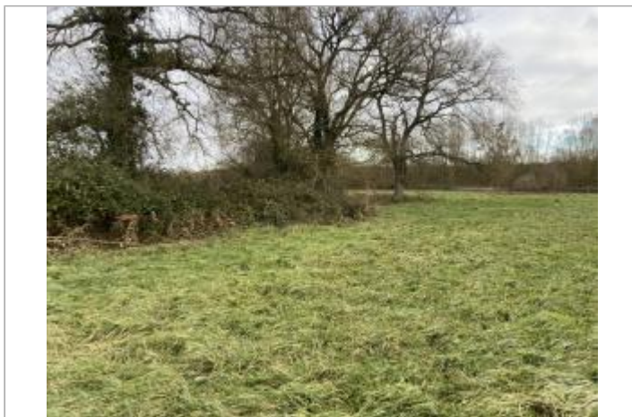
Vue du site - auteur : AGERIN