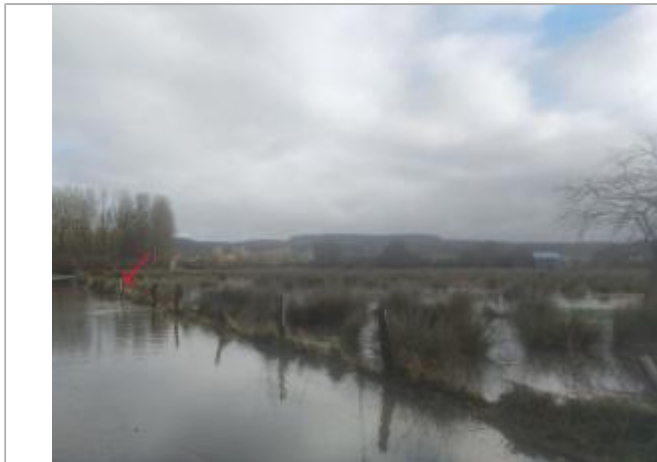
Vue d'ensemble_site_route des ponts gras

Coordonnées WGS84 : X: 0.59483077 / Y: 49.32746400