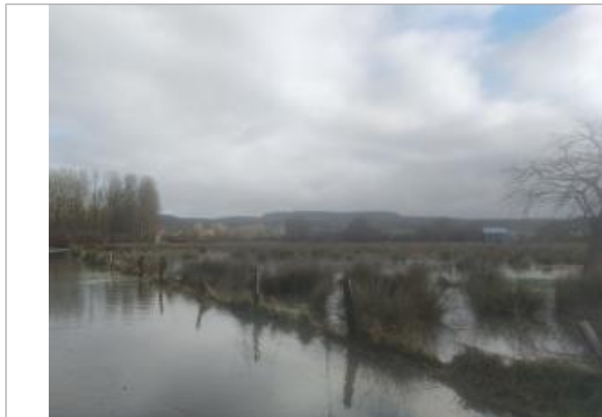
Vue d'ensemble_repère 5ieme poteau à partir du têtard avec 18cm d'eau (source SMBVR)

NIVELLEMENT SPC SACN. LE SPC N'EST PAS GÉOMÈTRE EXPERT, LES COTES SONT DONNÉES À TITRE INDICATIF. - 10/07/2025