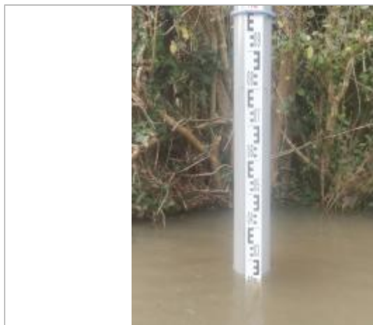
Vue rapprochée_24.5cm de hauteur d'eau au niveau du lampadaire

NIVELLEMENT SPC SACN. LE SPC N'EST PAS GÉOMÈTRE EXPERT, LES COTES SONT DONNÉES À TITRE INDICATIF. - 16/05/2025