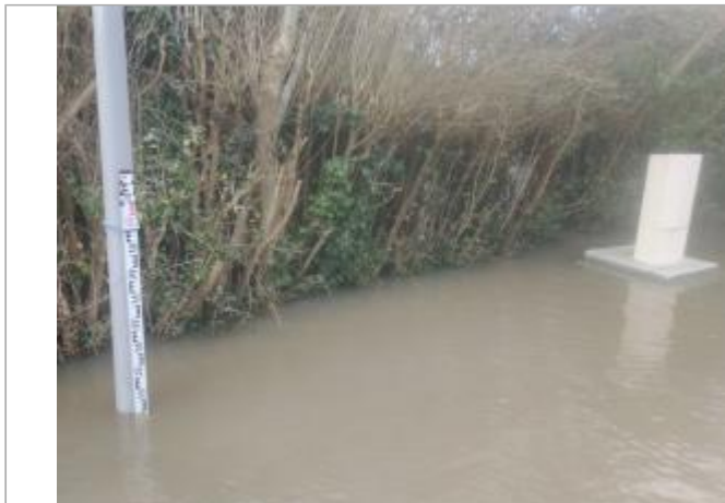
Vue éloignée_au bout de la rue de campigny