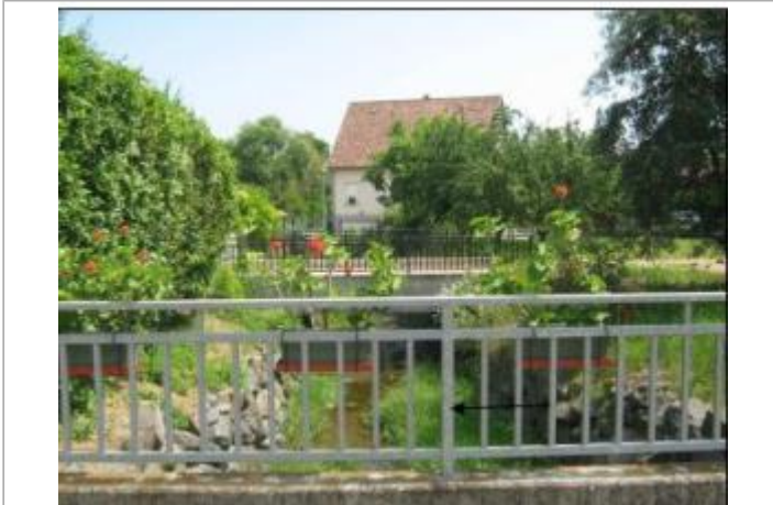
photo repère de crue