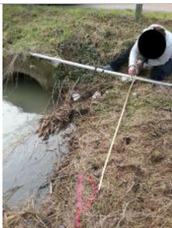
Laisse avec repère métré (DDTM14)

NIVELLEMENT SPC SACN. LE SPC N'EST PAS GÉOMÈTRE EXPERT, LES COTES SONT DONNÉES À TITRE INDICATIF. - 23/05/2025