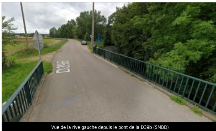
Vue de la rive gauche depuis le pont de la D39b (SMBD)

Coordonnées WGS84 : X: -0.06899290 / Y: 48.92413170