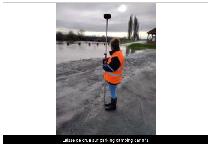
Laisse de crue sur parking camping car n°1