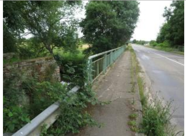
Vue de la route D77 , dos à Bruz

Coordonnées WGS84 : X: -1.74560790 / Y: 48.01463300