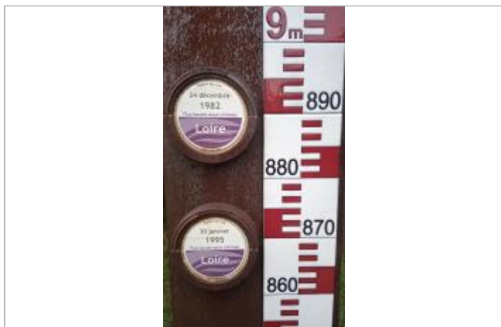
Vue sur les repères de 1982 et de 1995