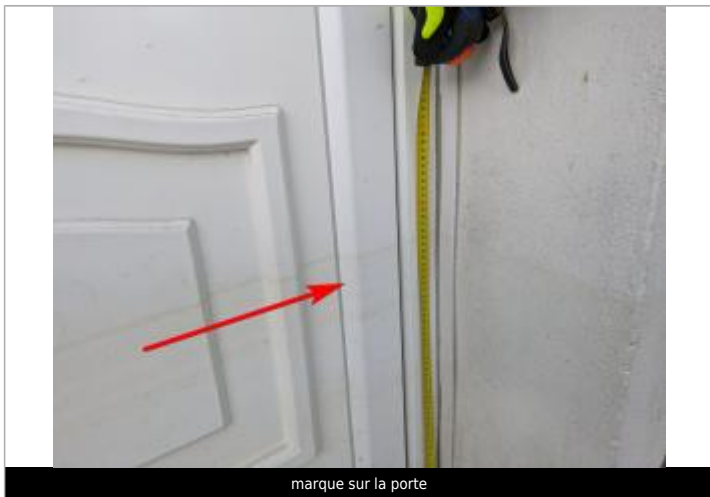
marque sur la porte

Altitude calculée de l'eau (en m) : 21.071 m