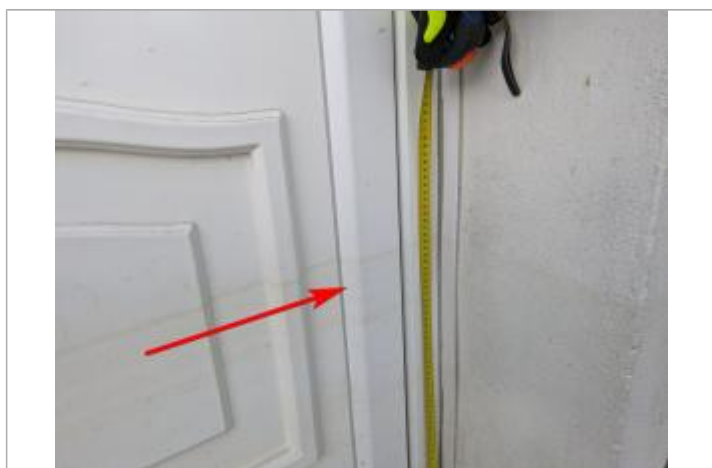
marque sur la porte

Altitude calculée de l'eau (en m) : 21.071