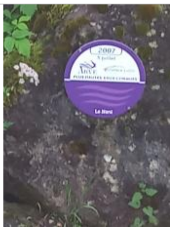
Passerelle sous le cimetière