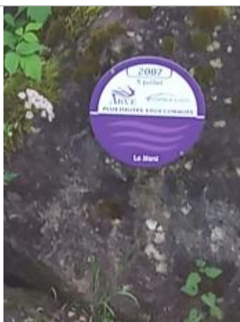
Passerelle sous le cimetière