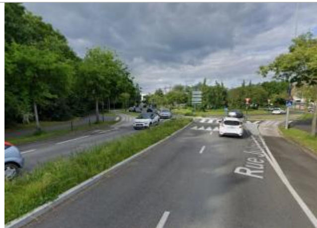
rond point, rue Jules Vallès