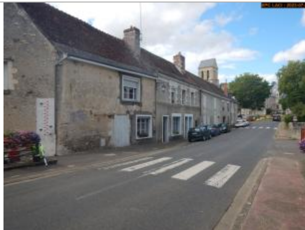
Vue du site en 2023