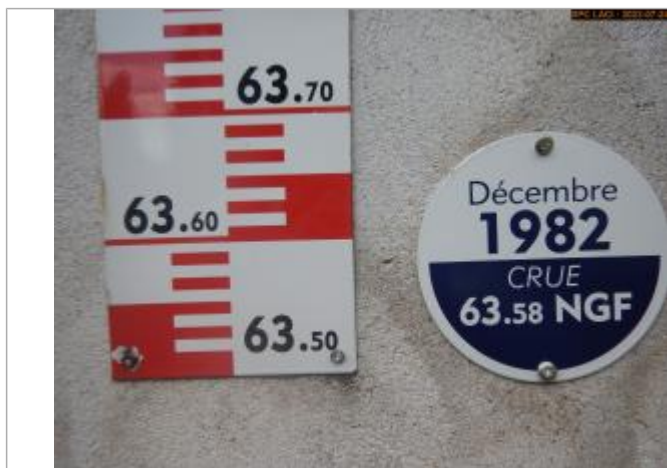
Vue du repère en 2023