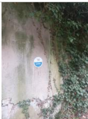
Photo du repère de crue sur le mur de l'usine côté chemin piéton, en 2024