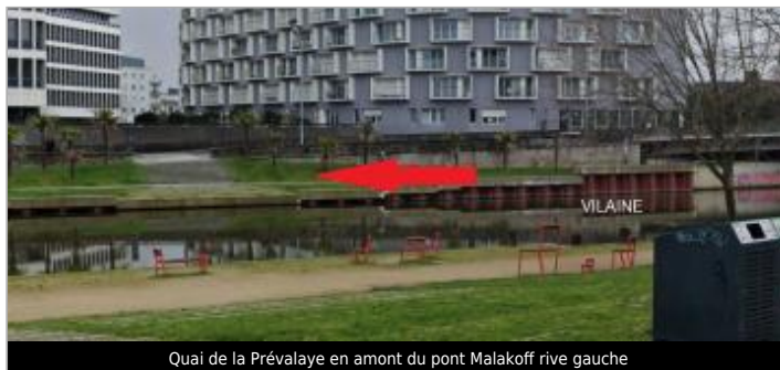
Quai de la Prévalaye en amont du pont Malakoff rive gauche