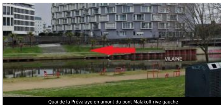
Quai de la Prévalaye en amont du pont Malakoff rive gauche