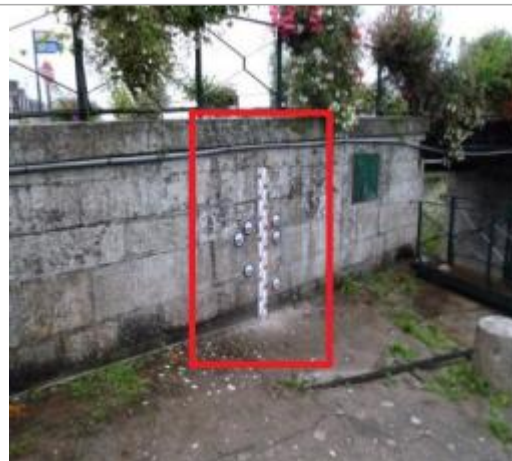
Mur amont du pont des Recollets coté écluse

Coordonnées WGS84 : X: -2.96616630 / Y: 48.07027900