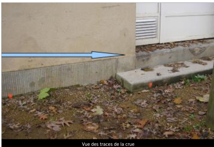
Vue des traces de la crue

SOURCE DE REPÉRAGE : CAMPAGNE DE RECENSEMENT SPC LACI 2022 -